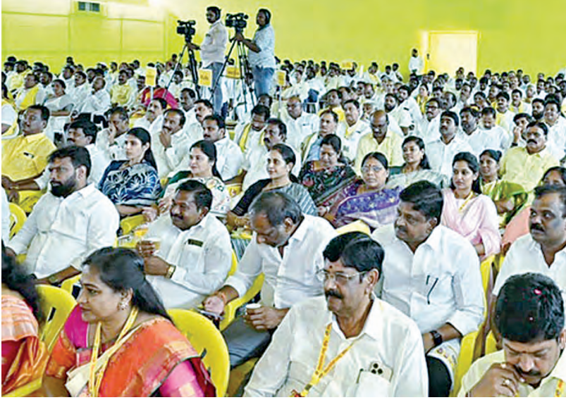
ఆదివారం టీడీపి విస్తృత సమావేశానికి హాజరైన ప్రజాప్రతినిధులు, మంత్రులు