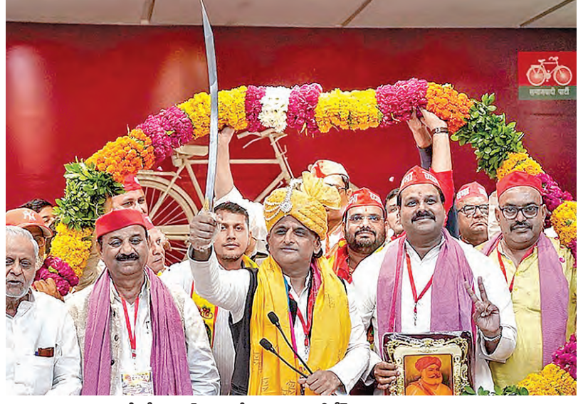
ఆదివారం లక్నోలో సమాజీవాది పార్టీ అధ్యక్షుడు అఖిలేష్ మిశ్రా సామాజిక సమావేశం

అధికారులు ప్రధాన నిందితులను అరెస్టుచేసేసింది. ఇప్పుడు అసలు టెండర్లు పిలవడం, ఆ తరువాత ఎలాంటి ఆర్డర్ లేకున్నా బోలెడంతా డెయిరీ నెయ్యినరఫరాకు అనుమతించడం వంటివి జరిగిందన్నారు. ప్రధాన సూత్రాలను ఎవరనేది తెల్లమంది. పట్టణంపై లక్షలలను కలుపుకునే పాపంలో రానున్న రోజుల్లో ఎవరిని విచారణ చేయమన్నారనేది ఇప్పుడు అంకితకమైన చర్చ మొదలైంది. ఈ కేసులో కెనాల్ లో శిక్ష ఎవరికి పడనుందనేది కూడా త్వరలోనే వీధిపోనుంది. తిరుమలకు 2019 నుండి 2024 మేల వరకు నెయ్యి నరఫరా అంశాలు ఇప్పుడు విస్తృతమవుతున్నాయి. సుప్రీంకోర్టు వెలువడింది అదేశాల మేరకు నకిలీనెయ్యి నరఫరా కేసు విచారణలో కీలక పరిణామాలు చోటుచేసుకోవచ్చునని తెలుస్తోంది.